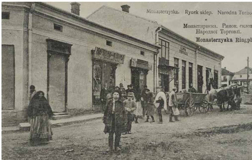
Coopérative à Lviv.

Afin de résister à la hausse sans précédent des prix, la coopérative rejoint l'Union des coopératives de consommation de Kherson et l'Union des coopératives de consommation du sud de la Russie, basée à Kharkiv. Mais, en 1918, Trudova Kopyka cesse ses activités.