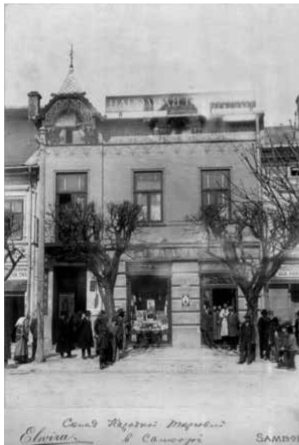
Entrepôt de coopérative à Sambor.