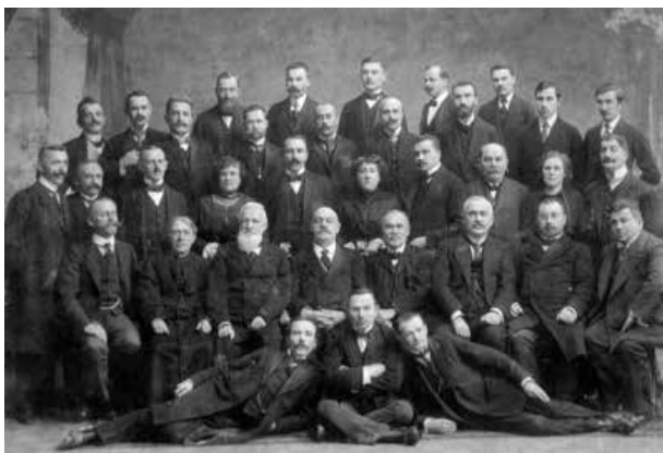
Membres de la coopérative Narodna Torgivlya à Lviv en 1913.

La révolution de février 1917 a considérablement modifié les conditions de développement des coopératives, car les obstacles politiques concernant le mouvement coopératif avaient disparu. Les coopératives ont été libérées de nombreuses restrictions et interdictions imposées par le régime tsariste et un champ juridique plus favorable à leurs activités a émergé. Dans le cadre du début de la guerre de libération nationale, un processus à grande échelle d'ukrainisation des coopératives existantes et de